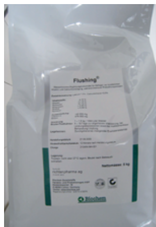
Abb. 6: Flushing – Ergänzungsfuttermittel

zwar ebenfalls Vitamin E und Selen als Wirksubstanzen enthält, aber als biotaugliches Futtermittel eingestuft ist.