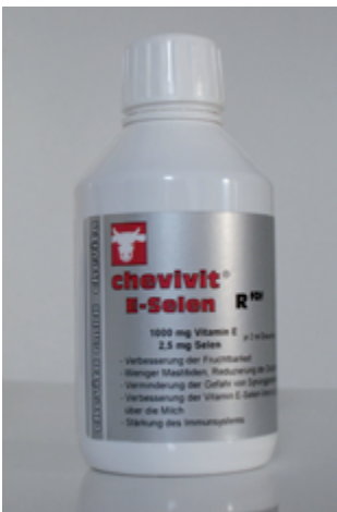
Abb. 4: Chevivit E-Selen® biotaugliches Ergänzungsfuttermittel – enthält Vitamin E und Selen

Futtermittel sind eindeutig auf der Verpackung und/oder auf dem Sackanhänger als solche gekennzeichnet, auch jene, die von Tierärzten abgegeben werden (z. B. Ergänzungsfuttermittel, Diätfuttermittel).