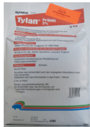
Abb. 7: Tylan – Arzneimittel mit Antibiotika

Tylan ist ein Arzneimittel, Flushing ist ein nicht biotaugliches Ergänzungsfuttermittel.