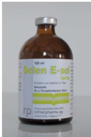
Abb. 5: Selen E-sol®-Arzneimittel – enthält Vitamin E und Selen

Das Injektionspräparat Selen E-Sol® (rechts, Abb. 5) ist ein Arzneimittel, während das über das Maul zu verabreichende Präparat Chevivit E-Selen® (links, Abb. 4)